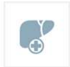
간이식 및 간담도외과